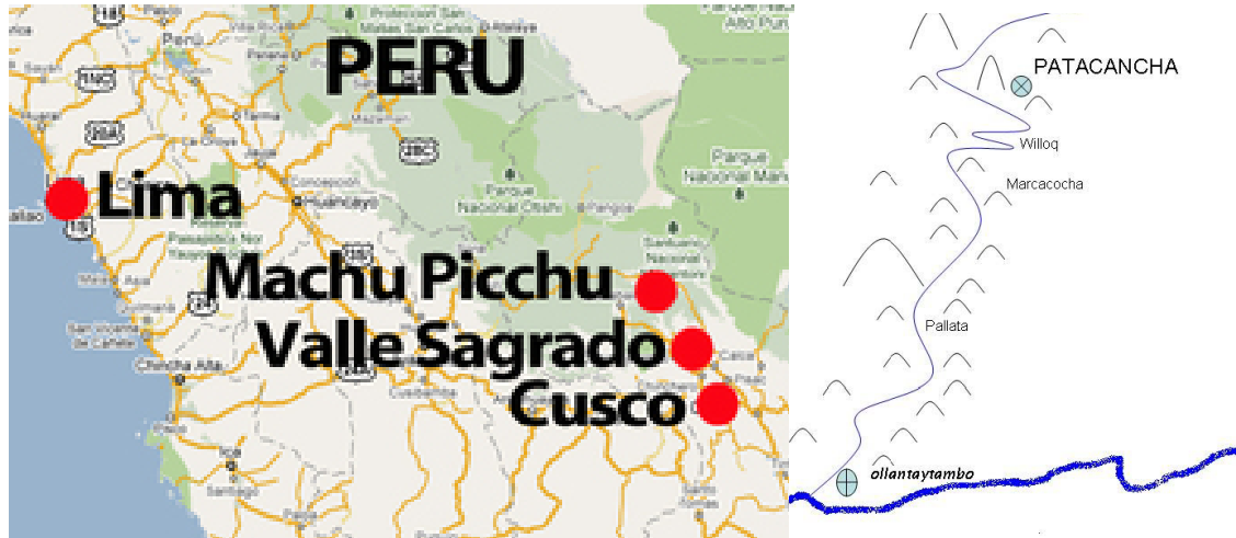
Valle Sagrado del Perú und der etwa 30 km lange Weg von Ollantaytambo nach Patacancha